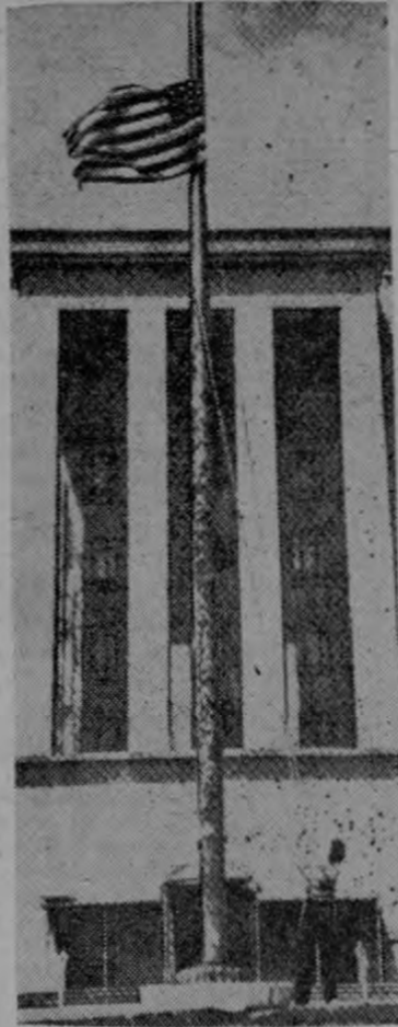
DUELO.—La bandera del Departamento de Estado a media asta, ante la muerte del ilustre ex-Secretario de Estado, John Foster Dulles