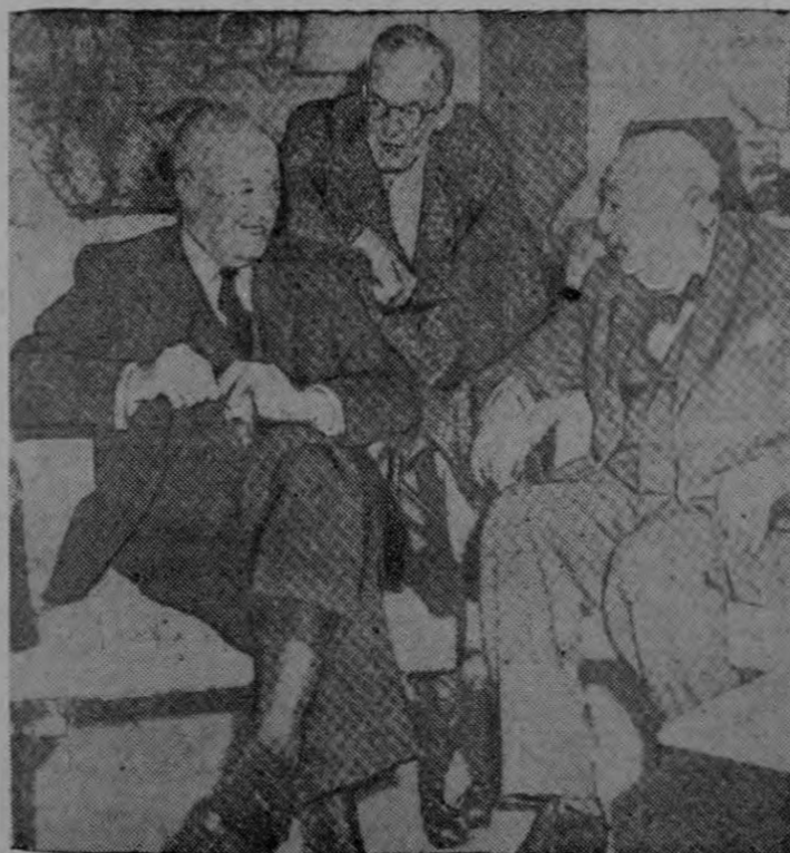
DULLES EL 5 DE MAYO.—Una de las últimas fotos de Dulles en el Hospital con el Presidente Eisenhower y Sir Winston Churchill, el 5 de mayo