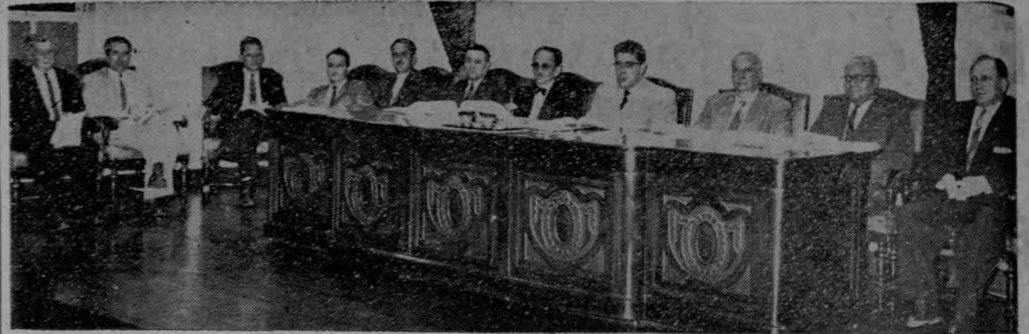
En la gráfica captada por Herradora aparecen los señores Magistrados de la Corte Suprema de Justicia, quienes el viernes por la noche inauguraron sus sesiones nocturnas, para resolver los numerosos asuntos que llegan allí. Es loable este trabajo de los señores Magistrados, que no devengan ningún

tor y brequero, por cuasidelito de homicidio. Se ha comprobado en las diligencias sumariales que el tren fue recargado de pasajeros, dando cabida a 560 personas, donde sólo se tiene capacidad para 460; también que el tren viajaba con luces apagadas y que iba a velocidad exagerada, pese a las advertencias y hasta sanciones que dispone la Gerencia de la empresa por esas faltas. Por todo lo anterior, al cerrarse este sumario se ha dictado auto de prisión y enjuiciamiento de los inculcados.