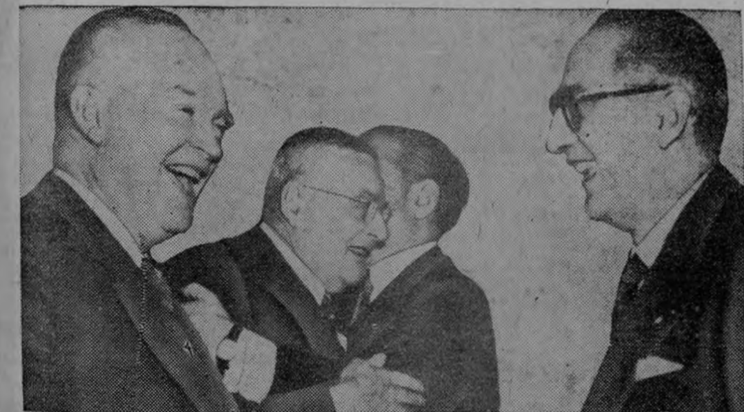
LA BIENVENIDA A FRONDIZI.—El Presidente Eisenhower da su bienvenida al Presidente Frondizi, de la Argentina, sosteniendo una jovial conferencia en la Casa Blanca, en el reciente viaje del mandatario argentino a Washington. En el centro, el ex-Secretario de Estado Dulles, abraza afectuoso al Embajador argentino, César Barros Hurtado. En esta conferencia se testimonió "el alto grado de las buenas relaciones" entre ambas naciones