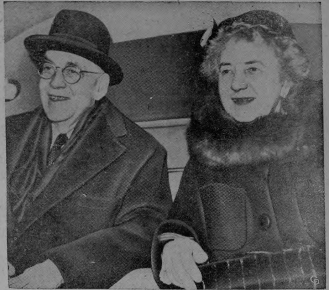
EL PASEO VESPERTINO.—El Secretario de Estado John Foster Dulles había dicho que se encontraba muy bien, cuando daba su paseo vespertino por los alrededores de Washington en compañía de su señora esposa. Esta fotografía fue hecha el 10 de febrero de este año, hora y media antes de ser internado en el Centro Médico "Hospital Walter Reed", del Ejército en Washington, para el tratamiento del cáncer abdominal que padecía