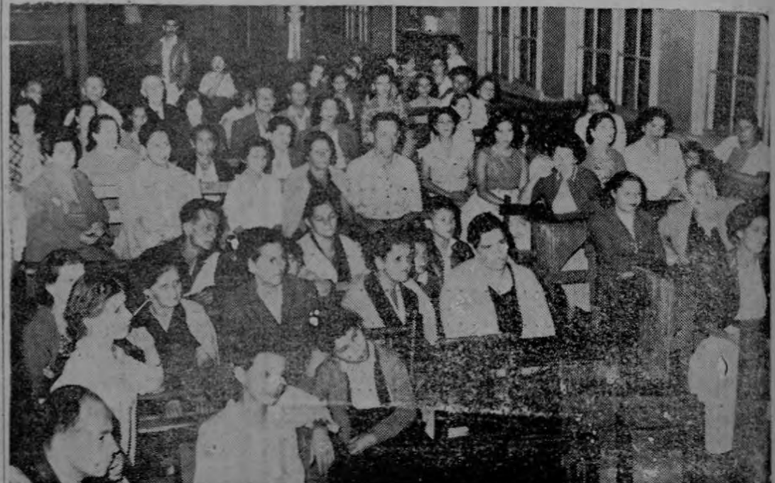
Anoche se reunieron maestros y padres de familia de Paso Ancho para abordar problemas escolares. La gráfica de Herradura ilustra la reunión.