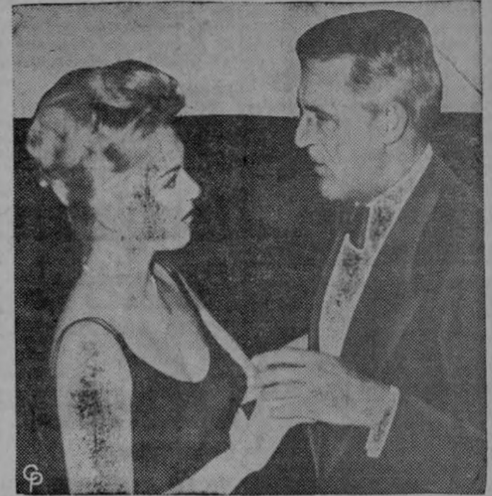
LAS ESTRELLAS SE DIVERTEN. — El cantante Eddie Fisher (arriba), ase a su esposa Elizabeth Taylor mientras caminan por las calles de St. Tropez, en la Riviera francesa. Abajo, las estrellas de cine Kim Novak y Cary Grant bailan durante una fiesta dada por la delegación soviética en Cannes, Francia. Posteriormente, al llegar a Milán, Kim casi causó un amotinamiento cuando apareció en público con un traje ajustado, con los hombros descubiertos.