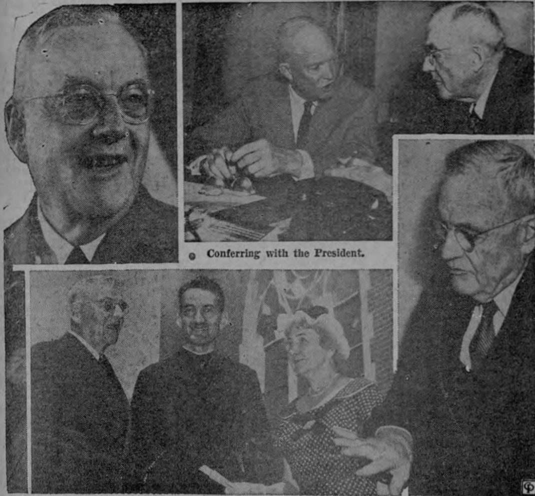
Conferring with the President.