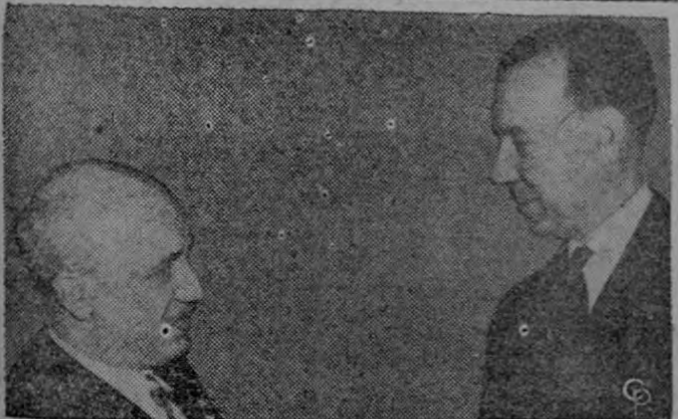
EN EL FRENTE DIPLOMATICO.—El representante soviético Premier Anastas I. Mikoyan y el ex-Secretario de Estado John Foster Dulles, se reúnen para conferenciar y cenar en Washington. Después se reúnen con el Presidente Eisenhower en la Casa Blanca. Abajo, el Premier italiano Amintore Fanfani (izquierda) y el Premier francés Michel Debre, se han reunido en París. En esa reunión conferenciaron acerca de las relaciones económicas entre sus países