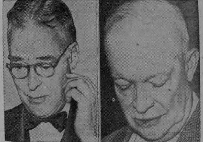
LA DECISION DE DULLES.—El Presidente Eisenhower (arriba, derecha) se reúne en el Departamento de Prensa de su residencia de vacaciones en Augusta, Ga., y ha anunciado la renuncia de Foster Dulles como Secretario de Estado. El cáncer abdominal que abata al ex-Secretario de Estado obliga a su internamiento en el Hospital Militar Walter Reed, en Washington, donde los médicos anotan nuevos progresos en la enfermedad. Arriba, izquierda, el Subsecretario de Estado Christian A. Herter, a la expectativa, en febrero de este año