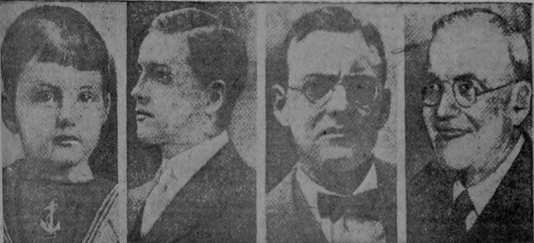
CUATRO ETAPAS EN LA CARRERA DE ILUSTRE ESTADISTA.—Dulles, niño, de 3 años en 1891; Dulles, estudiante en Princeton, en 1900. El internacionalista en 1923. Y actuando como Senador en Nueva York