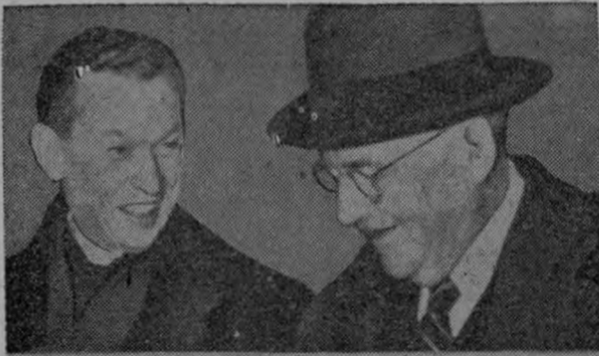
INVITACIONES INTERNACIONALES.—El Premier soviético Nikita Krushev hizo una invitación al Presidente Eisenhower a nombre de los soviets, para asistir a la clausura del XXI Congreso del Partido Comunista en Moscú. Krushev dijo a Eisenhower que verían con sumo agrado su visita. Entre tanto, el ex-Secretario de Estado John Foster Dulles reuniase en París con el Ministro de Asuntos Extranjeros, Maurice Couve de Murville (arriba, a la izquierda) para el asunto de las fuerzas aliadas destacadas en Berlín. Dulles, habla en Londres con el Primer Ministro británico Mac Millan, que fue invitado a visitar a Krushev en Moscú el último mes